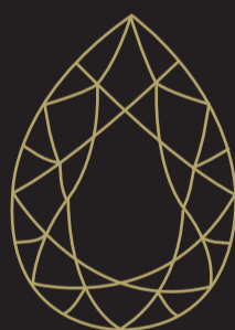
talla en pera